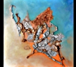
Chine - le style du peintre CAZORLA-CAZO