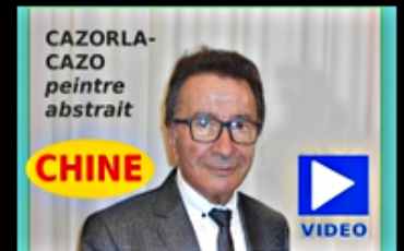
Chine - le style du peintre CAZORLA-CAZO