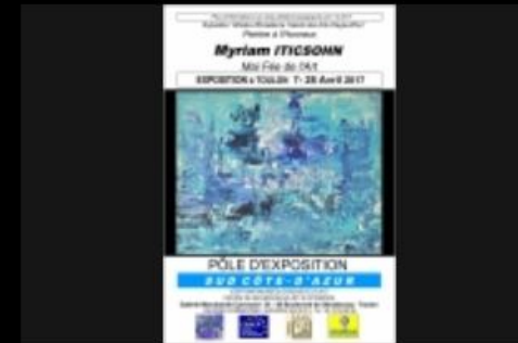
Exposition Myriam Iticsohn 2017