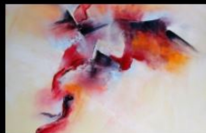
gros-plan sur "Vivacité" oeuvre de F. Dugourd-Caput