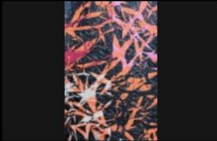
"Turbulence Magnétique" d'Alain DELIC (Huile 130x89cm laqué papier soie plissé sculpté Double support s. toile)