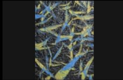
"Space Gravity" Alain DELIC (Huile 130x89cm huile laqué papier de soie plissé sculpté Double support sur toile)