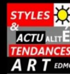
F. Dugourd-Caput style 2017