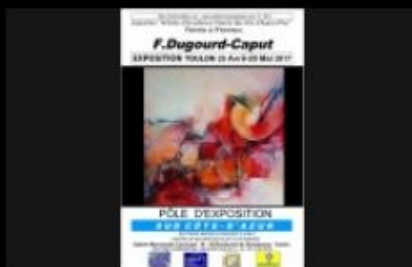
2017 F. Dugourd-Caput expose

cliquez sur les images pour les agrandir