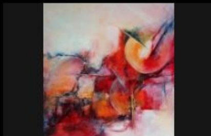
"MartiniDry" oeuvre abstraite signée F.Dugourd-Caput