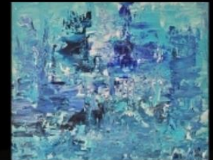
"Bleu" de Myriam Iticsohn, peintre